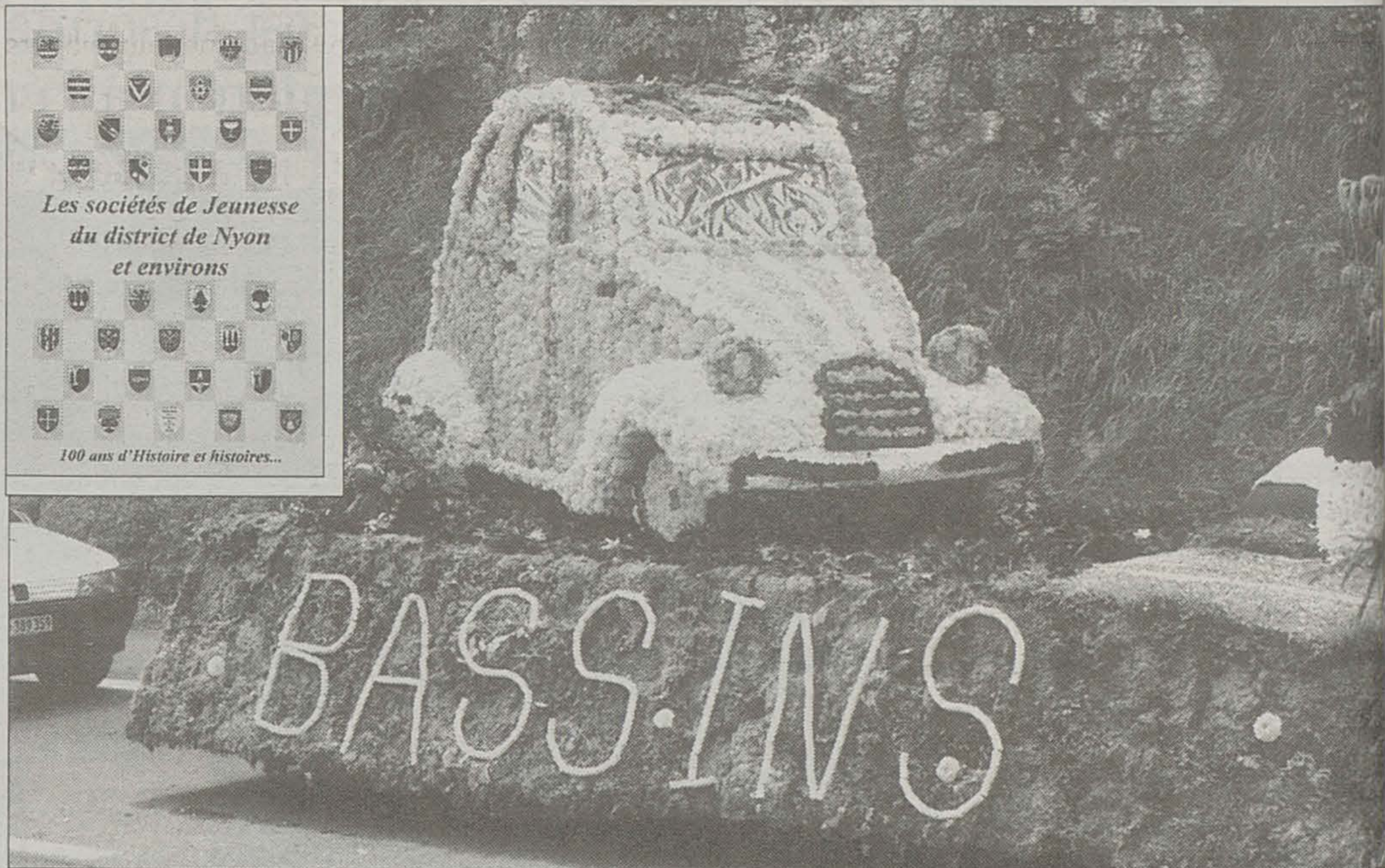
Le char de la Jeunesse de Bassins lors du Giron de l'an dernier à Saint-Cergue est à l'origine du logo de la fête de ce week-end. En médaillon, la couverture de la plaquette éditée à cette occasion.

sions donnent également lieu à de savoureux comptes rendus.